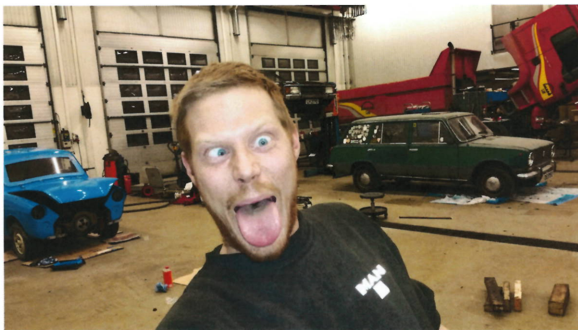
Og til slutt et bilde av den stolte eier.