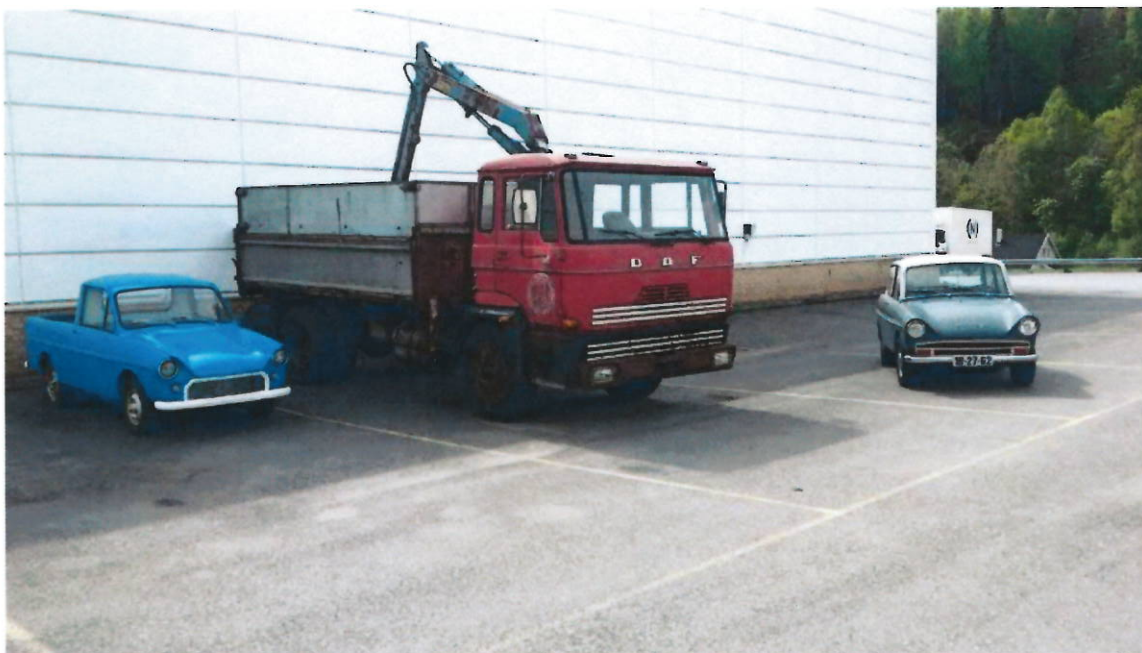
Hele DAF samlingen.